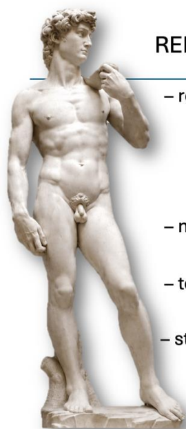
David, Michelangelo, 1501. – 1504.