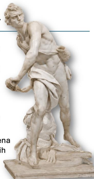
David, Bernini, 1623. – 1624.